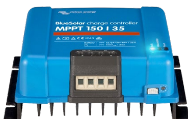
Zonne-laadcontroller MPPT 150/35