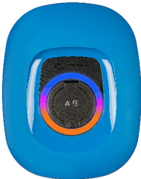
EV Charging Station NS