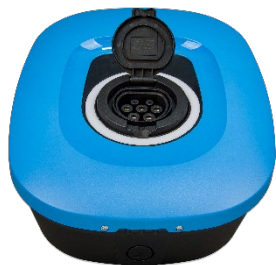
EV Charging Station NS - front