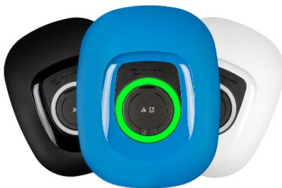
Zwart, blauw (standaard) of wit front