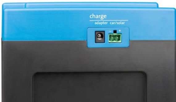
Adapter en ingang auto/zonnepaneel (contrastekker voor de auto/zonnepaneel ingang wordt)