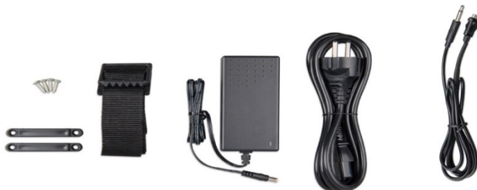
Bevestigingsband Adapter Netsnoer Drukknop met kabel (2 m) en twee kleuren LED