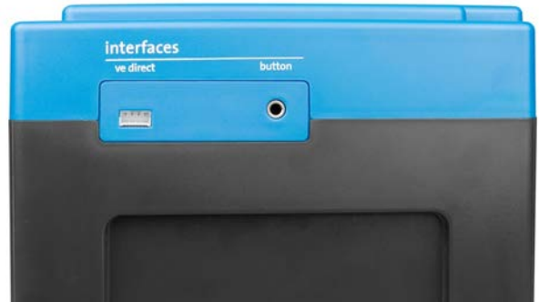
VE.Direct en drukknop