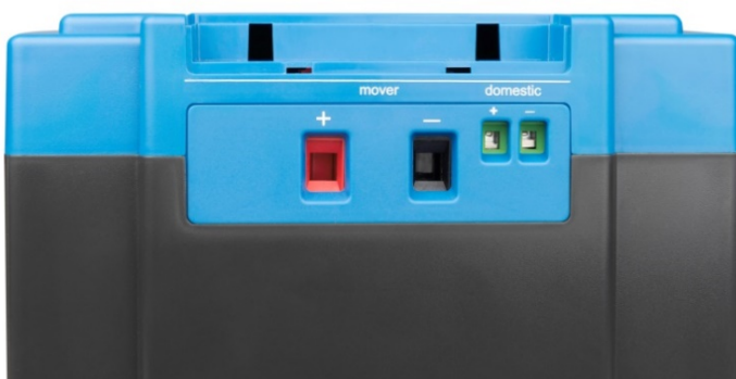
Hoog vermogen uitgang (mover) en laag vermogen uitgang (domestic)